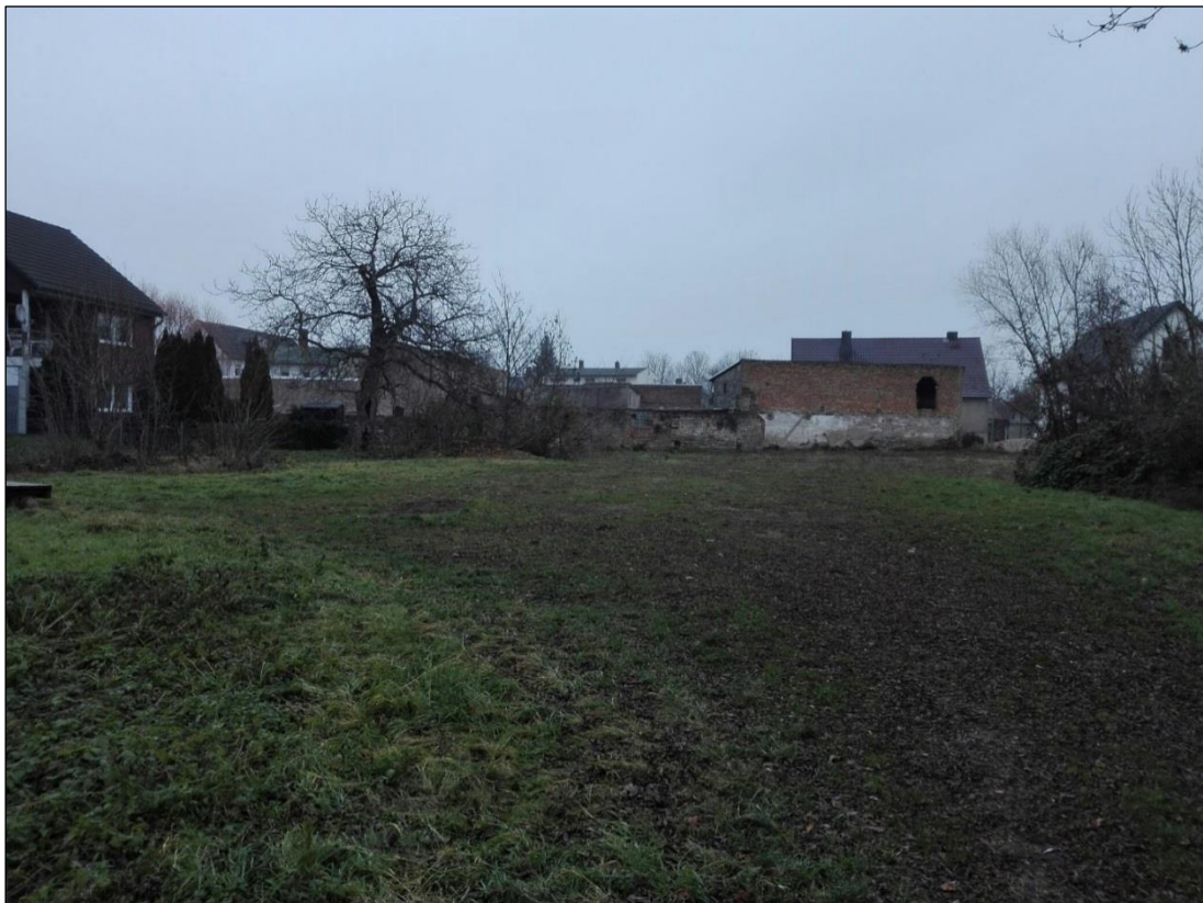
Grundstücksansicht von Westen